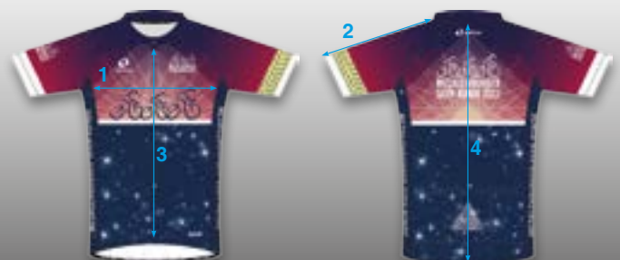
CYCLING Basic, Kurz Ärmeln